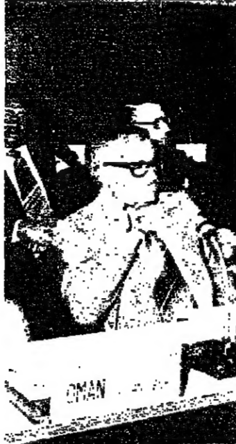
مشاركة عمان في المؤتمرات الدولية ويشاهد وفد السلطنة في مؤتمر الاسماك العالمي الحادي عشر .

كما قام وفد السلطنة بتوزيع ورقة عمل تمكس نشاطات الثروة السمكية في السلطنة والمشاريع السمكية التي تعتمزم تنفيذها في الخمس سنوات القادمة وتحتوي الورقة كذلك على معلومات شاملة عن انواع الاسماك وقبيلتها التجارية وامكان تواجدها في المياه العمانية .